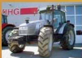
Lamborghini R5.130 , 130 PS, Bj. 2004, 4150 Bh, Klima, DL, FG, Lastschaltgetriebe 54/54