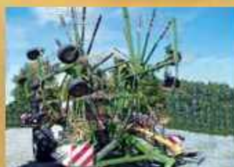
Krone KS 1250 , Bj. 2003, 4-Kreisel Mittelschwader, AB 12,5 m, UL-Zweipunktanbau