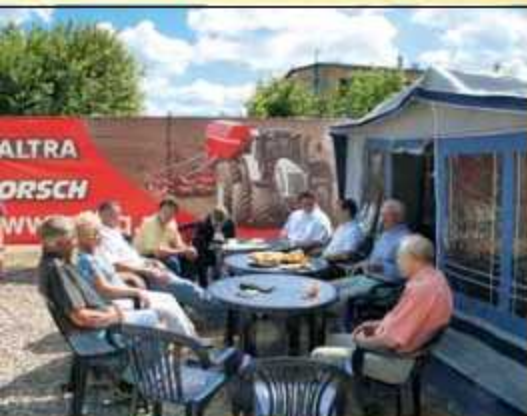
Einweihungsfeier in Ploty 2010