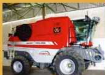
MF 9895 Fortia , Bj. 2009, 420 Bh, 870 ha, SW 9,2 m mit Rapsschnecke, GTA II Term.