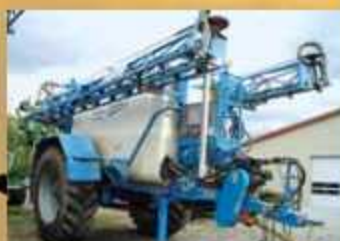
INUMA IAS5024 , Bj. 2003, Luftfederung, ZW-Antrieb, Selection Contr., Multiselect