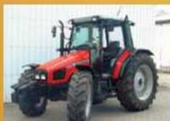
MF 4355 , 95 PS, Bj. 2003, 5450 Bh, Klima, DL, FG, 24/24 Gang Power Shuttle