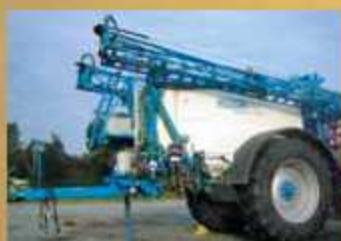
INUMA IAS5024 , Bj. 2008, Deichsellkg. man., Dist-Con- trol, IDN-POM, Vario-Steuer.