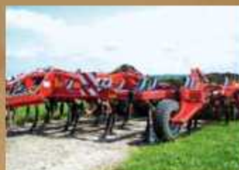
Tiger 6AS Bj. 2007, Zug- pendelanhäng., Terra-Grip Zinken, TopRing Packer