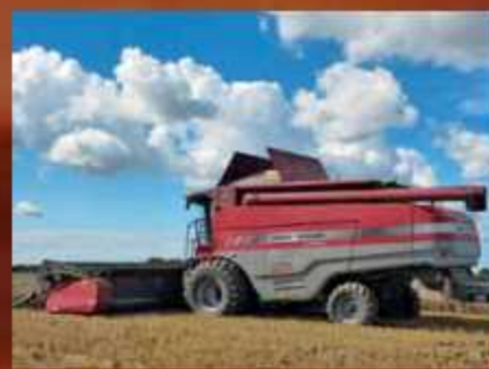
Der Hybrid Delta 9280 im Einsatz bei der Agrargesellschaft Hellbach

Unser Angebot reicht von konventionellen 5 – 8 Schüttlermaschinen, über Rotordrescher, bis zu den jetzt neu in Etappen eingeführten Hybridmodellen. Damit können Kunden aller Betriebsgrößen bedient werden.