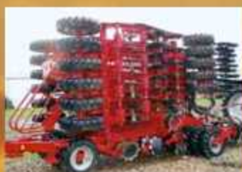
Horsch Pronto 6 DC PPF , Bj. 2009, DiscSystem, Doppeltank inkl. PPF-System