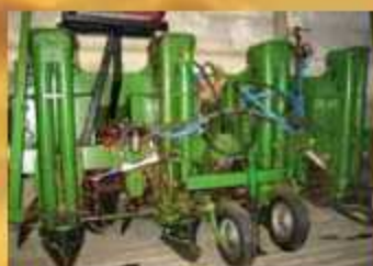
Hassia KLS 4B Bj. 1997, 4-rhg., hydr. Kippbunker, Reihenabstand 70-76 cm,