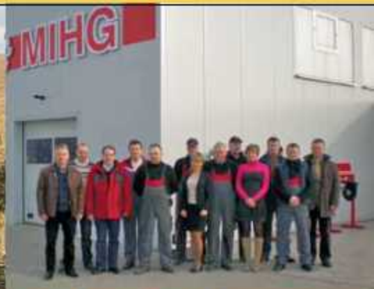
Unsere Mannschaft der MIHG Polska