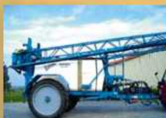
INUMA IAS4536 , Bj. 2000, ZW-Antrieb, Luftfederung, Deichsellenk. SprayControl