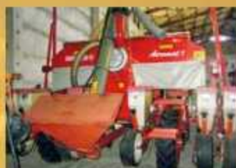
Becker Aeromat 6-reihig , Bj. 1997, teleskopierbar, RA 75 cm, Düngerbefüllschnecke