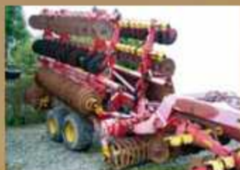
Väderstad Carrier 820 Bj. 2001, AB 8,2 m, Zugöse