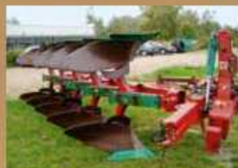
Kverneland EG 85-HD , Bj. 2003, Steinsicherung, Packer EP 800