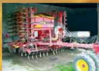
Väderstad Rapid 600 F , Bj. 1997, Agrilla, hydr. Gebläse- antrieb, Zwischenachspacker