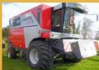
MF 7278 Cerea , Bj. 2008, 726 Bh, 559 Th, 1393 ha, SW 7,7 m mit Rapsschnecke