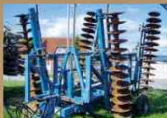
Frost XS 6 , Bj. 1997 hydraulisch klappbar, Winkelverst. mechanisch